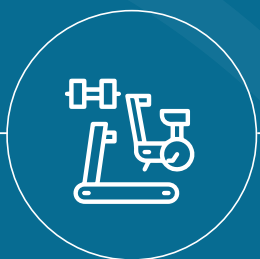
Espacio para Gimnasio