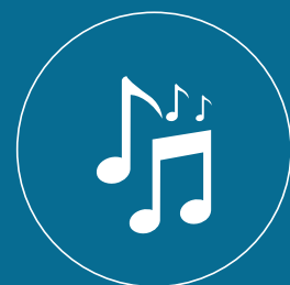
Salón de eventos