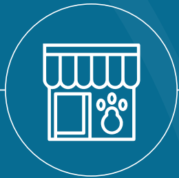
Zona de lavado de mascotas