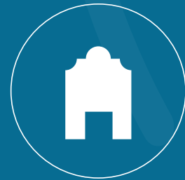
Lobby extra altura